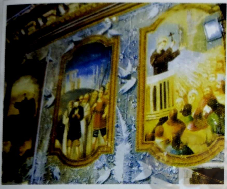
അന്തോണീസ് പുണ്യവാന്റെ അത്ഭുതങ്ങൾ

കൂട്ടി ലി രി ക്കു ന്വോൾ കപ്യാർ താക്കോൽക്കൂട്ടങ്ങൾ ഭ്രംസ്യോപുണ്യവതിയുടെ അൾത്താരയ്ക്കു പിന്നിൽ ഒളിപ്പിച്ചുവയ്ക്കുന്നത് കണ്ടിട്ടുണ്ട്. അവിടെ ചെന്ന് താക്കോലുകൾ എടുത്ത് അരയിലെ ചരടിൽ തൂക്കി. മദ്ബഹയ്ക്കു മുകളിലുള്ള ത്രിത്വത്തെയും പള്ളിയകത്ത് കല്ലിലും മരത്തിലും ചായത്തിലും ലോഹത്തിലുമുള്ള