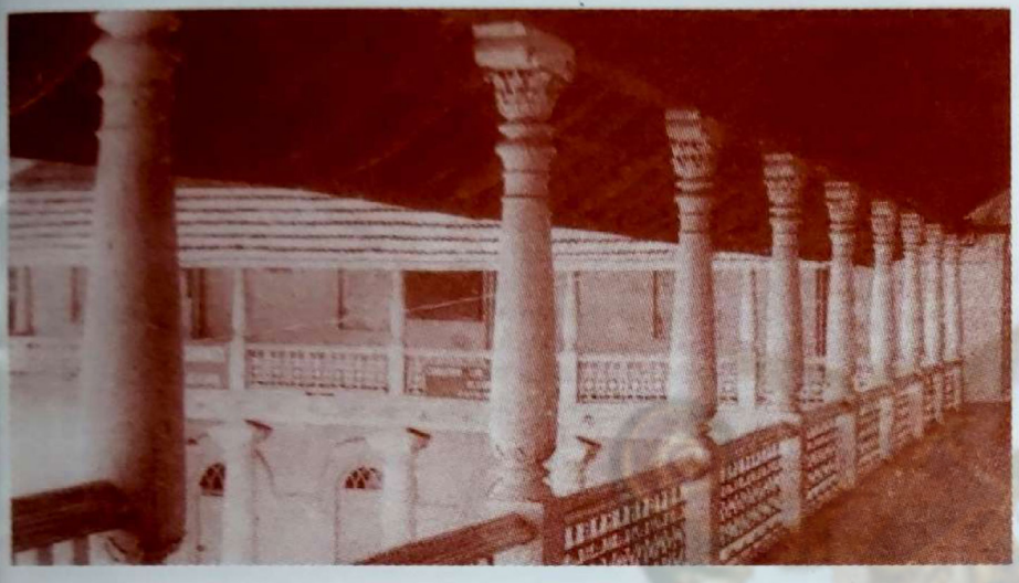
വരാന്തകൾ വിജനമായിരുന്നു; വലിയ ഗോവണിയും.

എന്റെ മകൻ ജീവിച്ചിരുന്ന പ്പോൾ കാനായിലെ കല്യാ ണാവസരത്തിൽ ഞാൻ ഇട പെട്ട് വീഞ്ഞുണ്ടാക്കിക്കൊടു ത്തു. ഇപ്പോഴാണെങ്കിൽ എന്റെ മടിയിൽ ജീവനറ്റു കിട