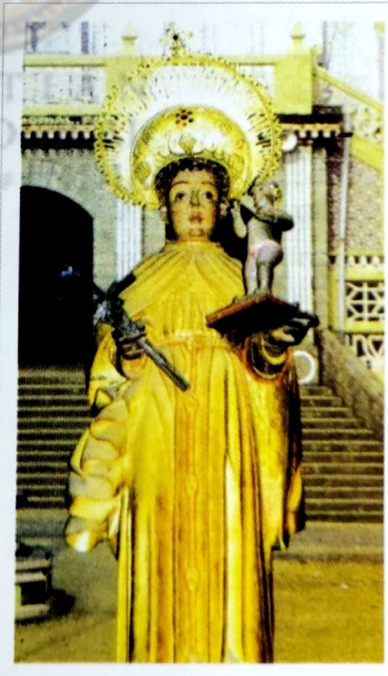
അന്തോണീസ് പുണ്യവാനാകു ന്വോൾ കൂടെ ഉണ്ണിയും ഉണ്ടാവാതിരിക്കില്ല