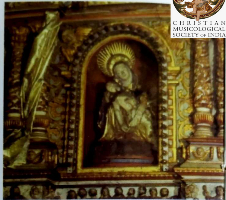
ജീവനറ്റു കിടക്കുന്ന മകനോട് ഒന്നും പറയാൻ നാക്കു പൊത്തുന്നില്ല.

ക്കുന്ന മകനോട് ഒന്നും പറയാൻ നാക്കു പൊത്തുന്നില്ല. പെരുന്നാളിന്റെ ഈ ദിവസങ്ങളിൽ വീഞ്ഞിന് ഒല്ലൂരിൽ പഞ്ഞമുണ്ടാകില്ലെന്നറിയാം. എന്നാൽ മറ്റു പലതിന്റെയും കുറവുകൊണ്ട്