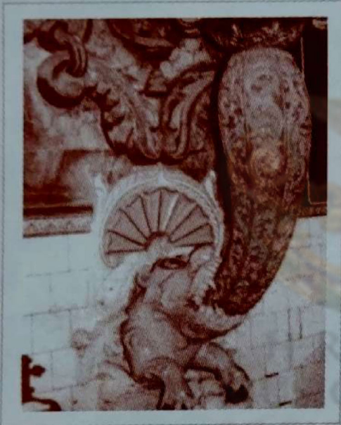
സിംഹത്തിന്റെ പുറത്ത് പതുക്കെ ചവുട്ടി

പ്ലോൾ ചർച്ചചെയ്ത സ്വർഗ്ഗത്തിലെ ചില ശുദ്ധവഴക്കുകളെ കുറിച്ചാലോചിച്ച് അന്തഃവിട്ടു നിൽക്കുകയായിരുന്നു എറപ്പായി മാലാഖ. അതുകൊണ്ട് തോബിയാസ് തന്റെ കൈ വിടുവിച്ചത് അറിഞ്ഞതേയില്ല.