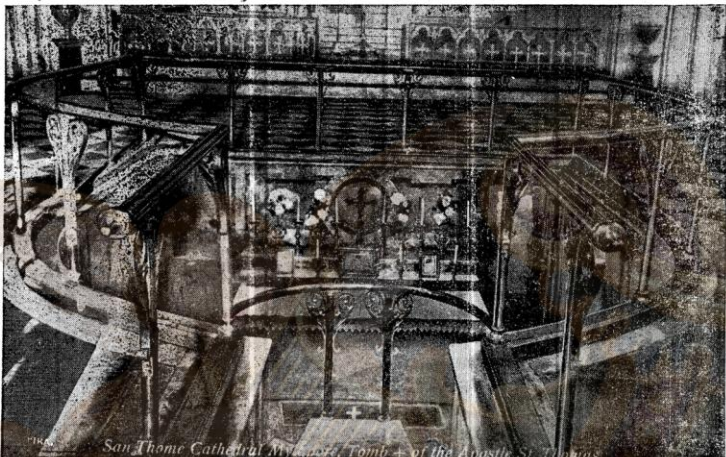
San Thome Cathedral Mylapore, Tomb of the Apostle St. Thomas

എ.ഡി, 68-ലോ, 72-ലോ, ആണല്ലോ പെരിയമലയിൽ വെച്ചുപരിശുദ്ധ ശ്രീഹൃദയുടെ രക്തസാക്ഷിത്വം നടന്നതു്. ഏറ്റത്താമസിയാതെ തന്നെ അവിടം ഭക്തജനങ്ങളുടെ ഒരു തീർത്ഥേതൃദേശമായിരുന്നു തുടങ്ങി. മൗണ്ടിന്റെ പുണ്യമഹോത്സവമൂലം ദൈവാലയത്തിൽനിന്നും പേർഷ്യൻ ക്രിസ്ത്യാനികളുടെ കടുംബങ്ങൾ അഭിമുഖമാക്കിയുള്ളിൽ തന്നെ അവിടെ കടപ്പാർപ്പു തുടങ്ങിയിരുന്നു. പിറ്റേ ലങ്ങളിൽ ഒട്ടേറെ അർത്ഥേതൃരും, സിറിയയും, 'നെസ്റ്റോറിയ'യും അവിടേയ്ക്കു് താമസം മാറുകയുണ്ടായി. 13-ാം നൂറ്റാണ്ടിൽ മാർക്കോ പോളോയും 14-ാം നൂറ്റാണ്ടിൽ ഓഡെറിക്കോബർഡോണും ദൈവാലയം സന്ദർശിച്ചപ്പോൾ പെരിയമലയിൽ പല ക്രൈസ്തവവിഭാഗങ്ങളും നിലനിന്നിരുന്നു; അവർക്കും പള്ളികളുമുണ്ടായിരുന്നു. 16-ാം നൂറ്റാണ്ടുവരെ പല ദേവാലയങ്ങളും അവിടെ ആവിഷ്കരിക്കുകയും അന്തർധാനം ചെയ്യുകയും ഉണ്ടായിട്ടുണ്ട്. 1441-നും 1500-നുമിടയ്ക്കു മാർക്കോപോളോ ക്രിസ്ത്യാനികളുടെ തമ്മിൽ ഗിരിപരസരങ്ങളിൽ വെച്ചു പ്രമുഖമായ ഒരു സമരം നടക്കുകയും, ക്രൈസ്തവ പക്ഷത്തിന്റെ അന്തിമ സന്ദേശമായിരുന്ന മലമുകളിൽനിന്നും അവിടം പലായനം ചെയ്യേണ്ടി വരികയുണ്ടായി. ഇതോടെ പെരിയമലയിലെ പൂർവ്വക്രൈസ്തവജനത നിന്നു